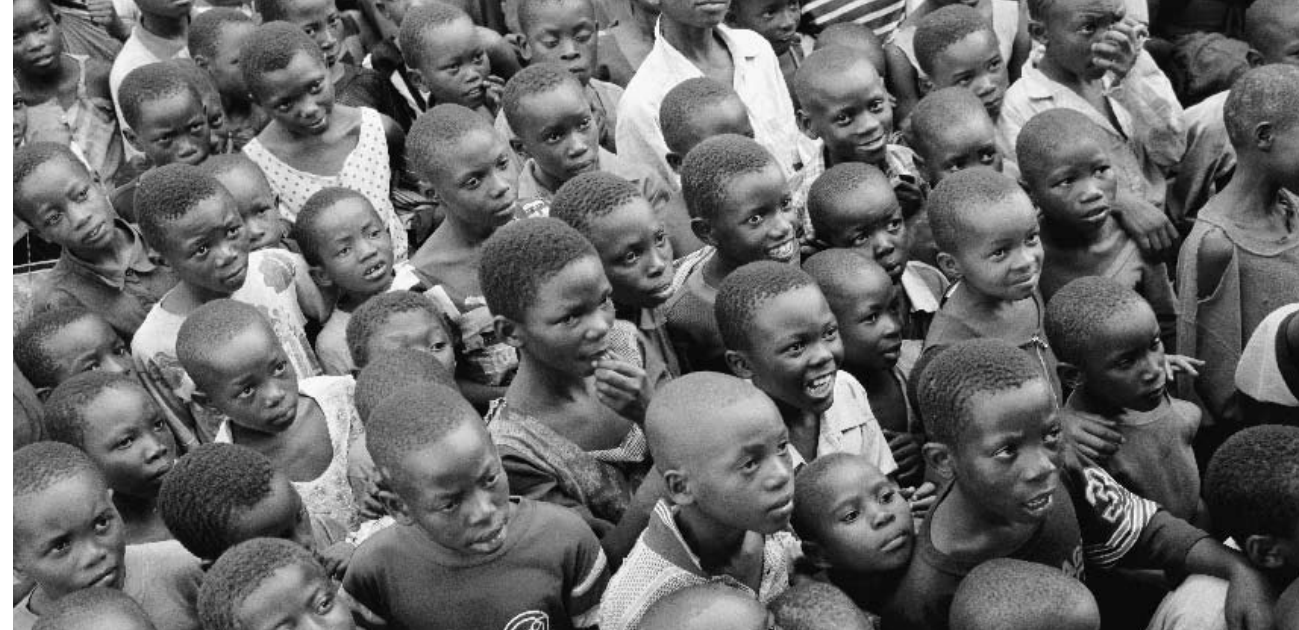
Die Bereitstellung eines Malaria-Präparats zum Produktionskostenpreis durch die Novartis trägt zur Erfüllung des Rechts auf Gesundheit bei.

Die Novartis Stiftung für Nachhaltige Entwicklung arbeitet im Falle der Lepra und Tuberkulose zusammen mit Partnern in Multi-Stakeholder-Initiativen an allen fünf Determinanten der Zugangsfrage. In der Lepa-Arbeit wird über Sozialmarketing das Stigma der Krankheit abgebaut, so dass sich Patienten zur Diagno-